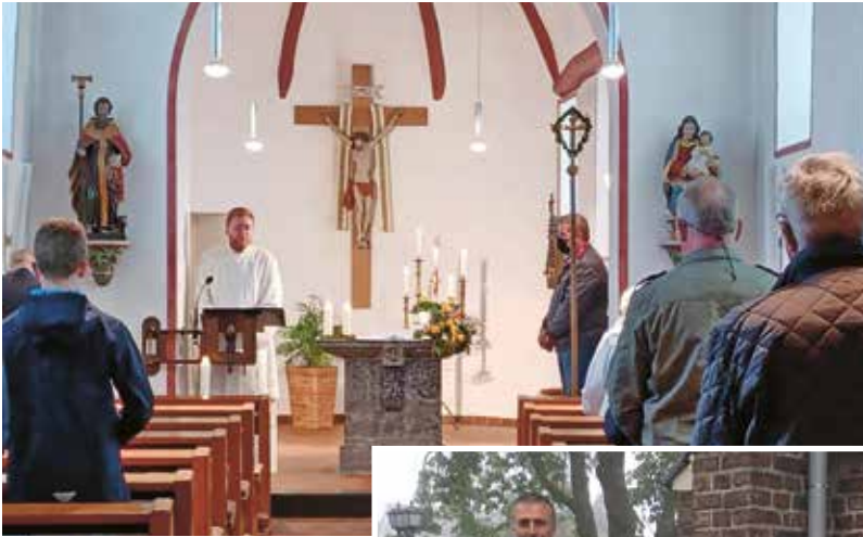
Gottesdienst in Niederdrees