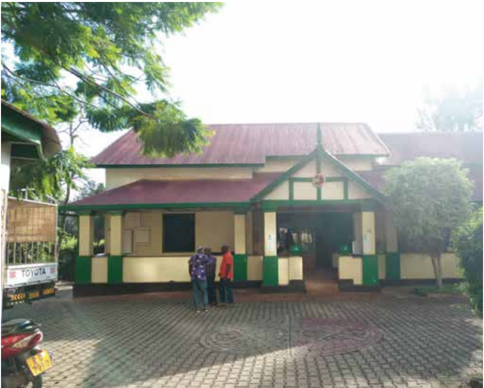
Koordinationsbüro in Kigali