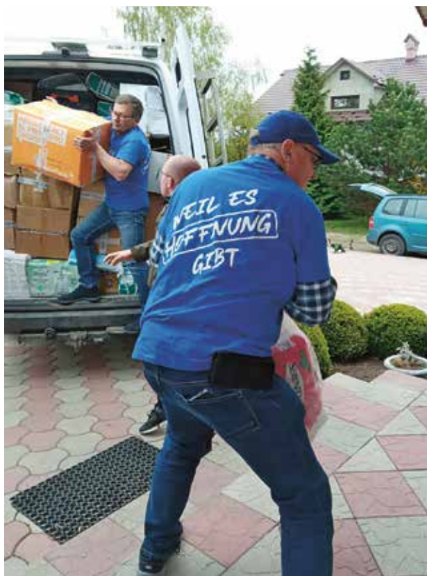
Hilfstransport in die Ukraine

Frühe aufstehen – und über die Grenze in die Ukraine fahren. „Dort haben wir ein Flüchtlingslager in Czernowitz an-