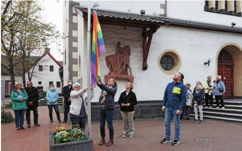
Hissen der Regenbogenfahne vor St. Martin