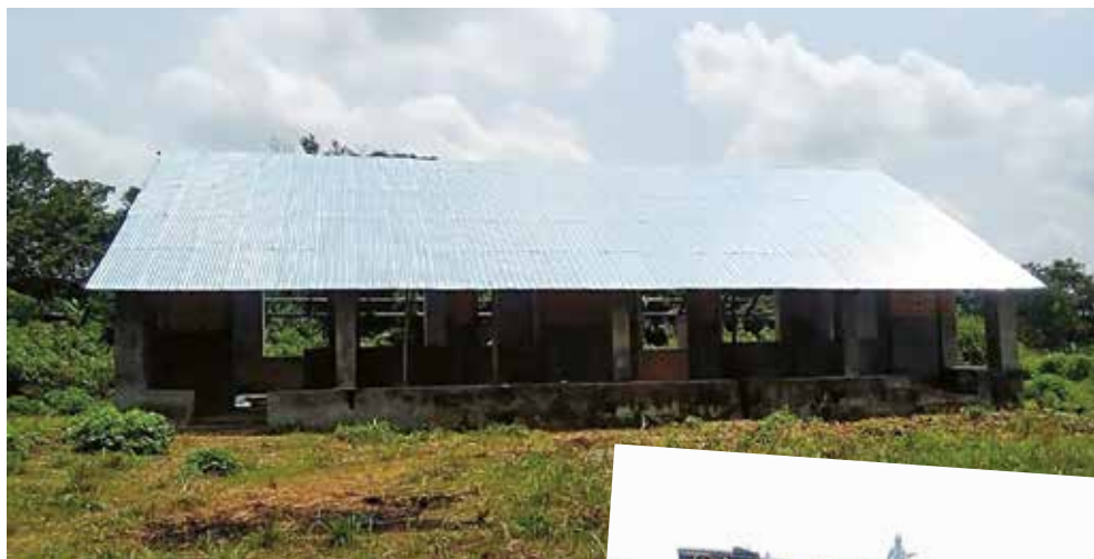
Neues Dach für Schule in Kindamba (oben) und Dacharbeiten (rechts)

L ängere Zeit schon gab es nichts mehr zu berichten. Wegen einer allgemein verordneten Corona-Pause mussten die Bauarbeiten über einige Zeit ruhen und sind seit dem letzten Bericht nicht wesentlich weitergekommen.