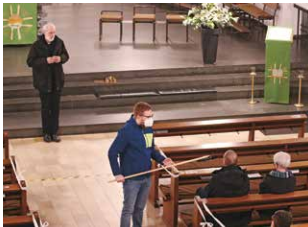
Weihbischof Ansgar Puff während der Fragestunde

Zum Abschluss ging es dann nochmals ans Eingemachte – an die zahlreichen Kircheng Austritte. Ob nicht manch ein Bischof denke, es sei doch gut, wenn man sich gesundschrumpfe und anstelle der vielen lauen und halbherzigen