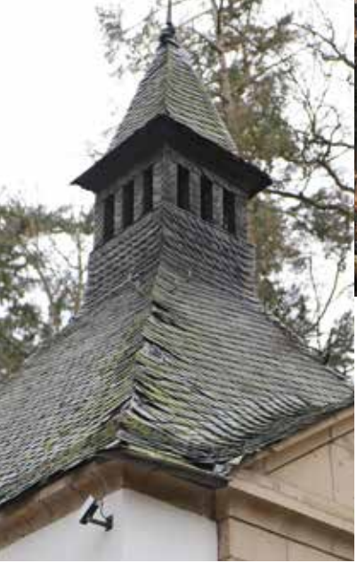
Baum stürzte auf Waldkapelle