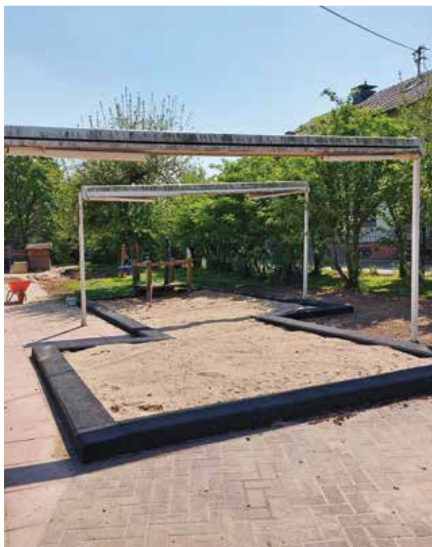
Außenanlagen der Kita St. Ursula Flerzheim nach dem Wiederaufbau

Auch hier geht es weiter: Die Elektroinstallation sowie der Putz und der Estrich im gesamten Kellerbereich wurden entfernt und nun erneuert. Gemeinsam mit der Leitung der Bücherei und der KjG wurde ein Farb- und Materialkonzept für die Gestaltung von Böden und Wänden entworfen und in Teilen bereits umgesetzt. Die Bücherei führt ihren Be-