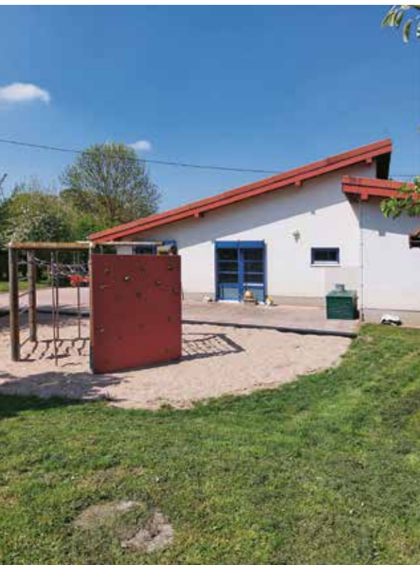
Kita St. Ursula Flerzheim nach dem Wiederaufbau

trieb nun zunächst mit eingeschränktem Angebot, aber großem Elan beschränkt auf die Räumlichkeiten im Parterre weiter. Durch den Wassereinbruch im Untergeschoss der Bücherei wurden mehr als 2.200 Medien zerstört, alle Regale und weitere Einrichtungsgegenstände, „Veranstaltungsmaterialien“ und ein Büroraum wurden unbrauchbar.