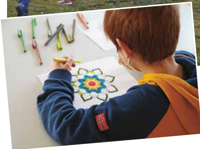
Impressionen vom Kommunion- Wochenende