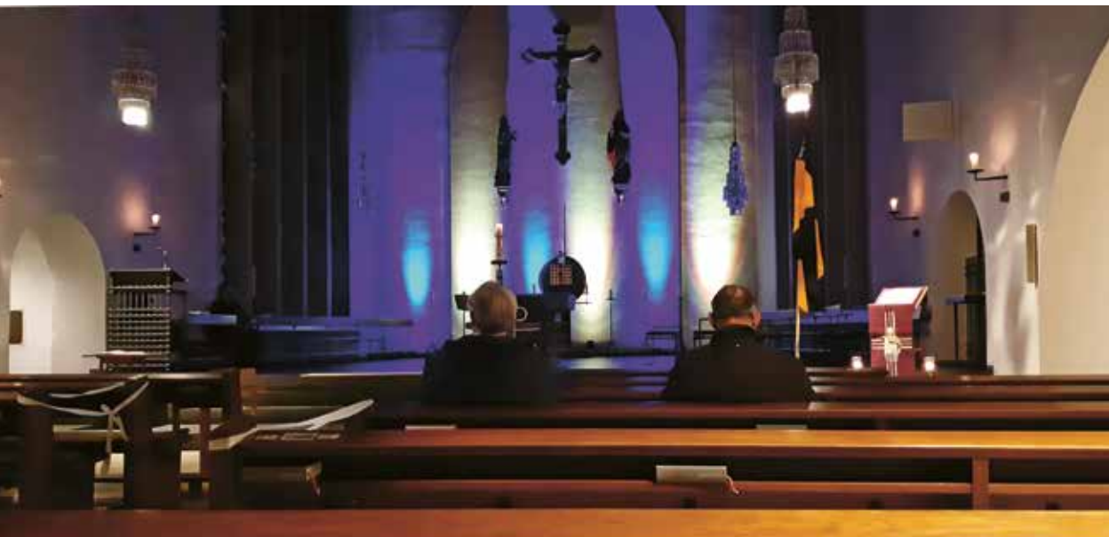
Tücher in den Nationalfarben der Ukraine – Blau und Gelb – auf den Altarstufen, die Kreuzigungsgruppe illuminiert in den gleichen Farben