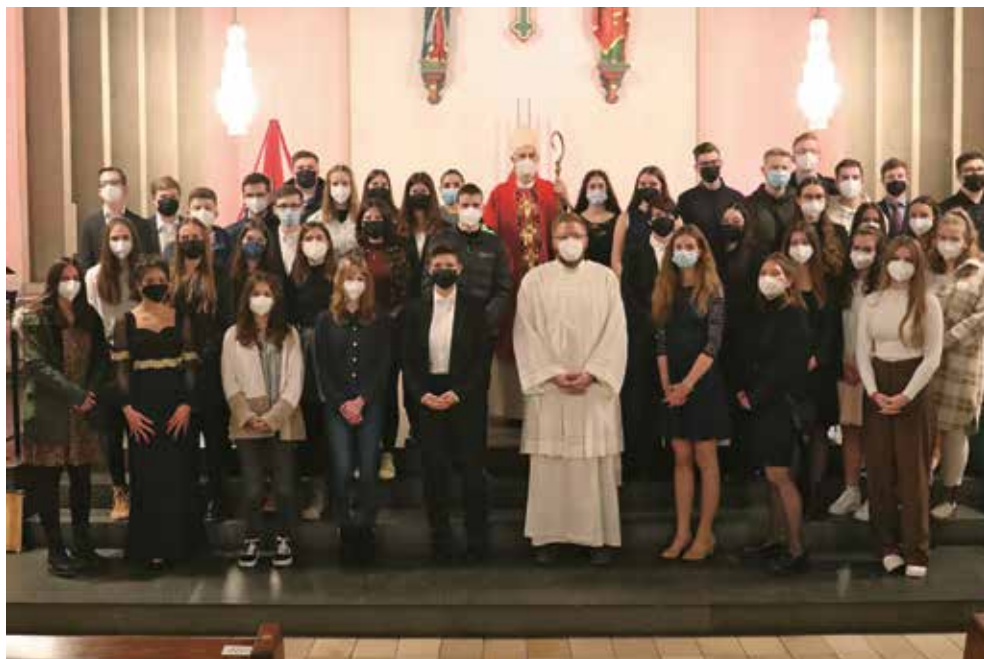
Die Firmgruppe in der Pfarrkirche

konnten wir die Firmvorbereitung doch endlich in analoger Form durchführen. Ein erstes analoges Treffen fand in den Räumlichkeiten des Live, des Pfarrzentrums und in der Pfarrkirche statt. Nach der Flut im Juli 2021 waren wir allerdings mit unserer Firmvorbereitung vor große Herausforderungen gestellt. Wir hatten keine Räume mehr, um uns zu treffen und unsere Veranstaltungen durchzuführen. Wir mussten improvisieren. So fanden die folgenden Firmveranstaltungen in der Pfarrkirche, auf dem Kirchplatz, auf dem Schulgelände