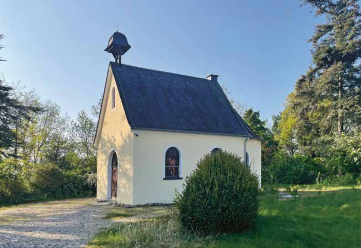
Die „Schönstattkapelle“ oberhalb der Pallottikirche