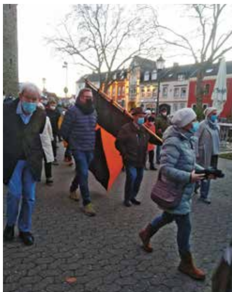
Friedensmarsch der Stadt Rheinbach

Was jedoch machbar war: Wir feierten gemeinsam Gottesdienst. So haben wir unseren Kolpinggedenk-gottesdienst im Dezember 2021 in St. Mariä Himmelfahrt in Merzbach gefeiert. In Merzbach deshalb, da diese Kirche eine besondere Bedeutung für die Kolpingsfamilie Rheinbach hat; denn dort ruhen im Altar Reliquien des Seligen Adolph Kolping, des Begründers des Kolpingwerkes.