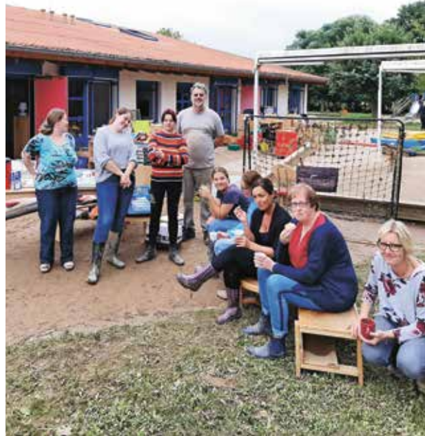
Das Kita-Team in Flerzheim während der Aufräumarbeiten nach der Flut

Doch was sind Gebäude ohne Leben? Erst wenn die Räume mit Menschen und gemeinsamem Tun erfüllt werden, erfüllen sie ihre Bestimmung. Allerdings wird es noch einige Monate dauern, bis wir wieder Gottesdienste feiern und auch das Pfarrhaus komplett nutzen können.