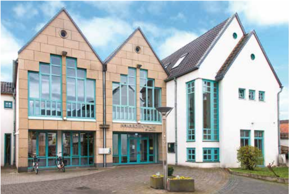
Das Katholische Pfarrzentrum St. Martin mit der Bücherei